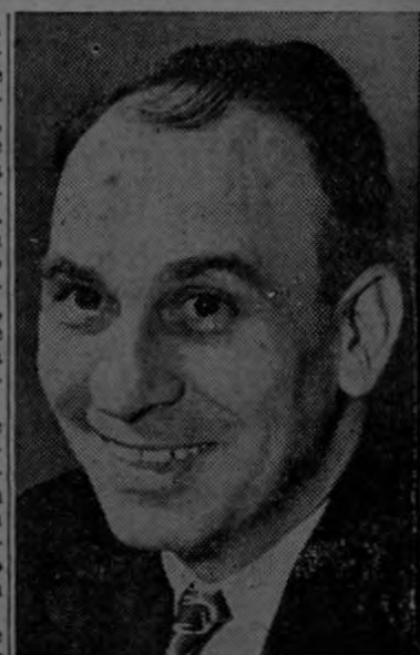
Donald S. Russell

Russell colaboró con Byrnes hasta que se nombró a éste Director de Movilización. En 1944 retornó al ejército y siendo mayor en Francia, Byrnes le nombró Subdirector